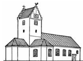
St. GANGOLF, WOLPERTSWENDE