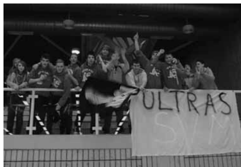
Unterstützung durch die Fans

Erwartungsvoll fuhr die B-Jugend zum Bezirksfinale nach Friedrichshafen. Auch Dank der lautstarken Unterstützung einer mitgereisten Fangruppe, gingen die Jungs bis in die Haarspitzen motiviert in das Turnier. In der Gruppenphase