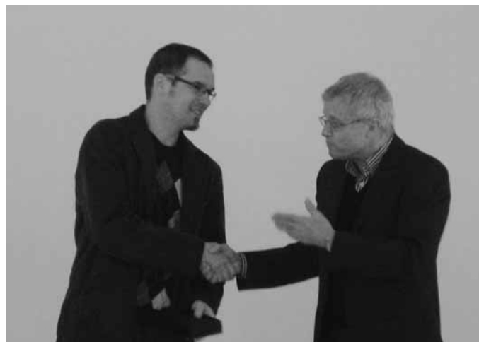
Konrektor Malang und Rektor Pechan