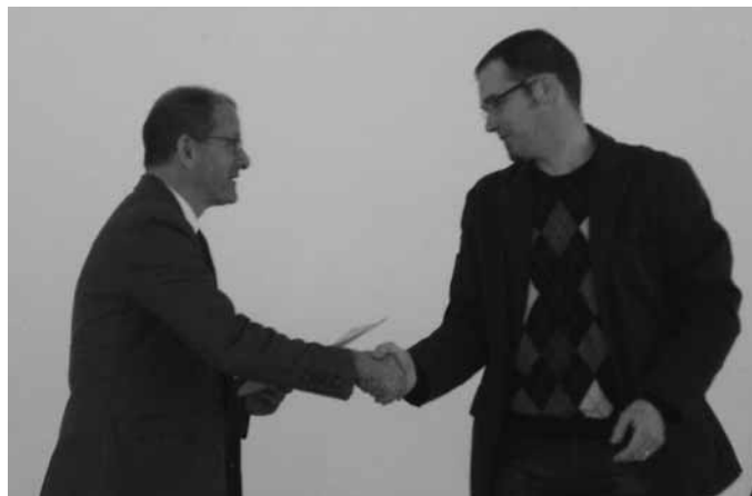
Schulrat Damm überreicht dem neuen Schulleiter die Ernennungsurkunde

Die offizielle Einsetzungsfeier findet am 9. März 2010 in Mochenwangen statt.