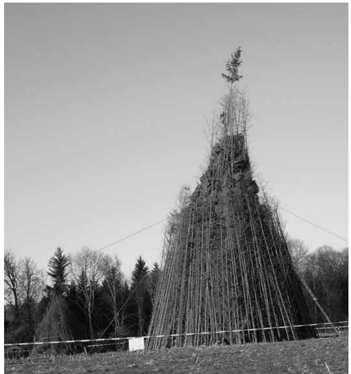
Unser Riesenfunken aus dem Jahr 2008

Trotz Schneefall und Eiseskälte haben sich unsere Mochenwanger Funkenbauer auch dieses Jahr schon im Herbst an die Arbeit gemacht, um für diesen Sonntag droben an der Aulendorfer Strasse wieder einen Riesenfunken aufzurichten. Sicher freut sich nicht nur das Funkenbauerteam um Helmut Hermanutz auf dieses besondere Ereignis, wenn es wieder darum geht, den uralten Brauch des Winter-austreibens wach zu halten.