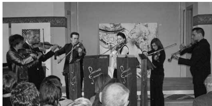
Das junge Streicherensemble Ponticelli begeisterte die Zuhörer

Auch Bürgermeister Heurich ging in seiner Dankadresse an die Initiatoren und Helfer beim Aufbau für dieses besondere Abschiedsgeschenk kurz auf das Thema ein. In seiner Amtszeit seien von der Gemeinde etwa 9 000 Euro für Kunstankäufe aufgewendet worden: wenn man dies auf die 24 Jahre hochrechne, dann wären dies jährlich ca. 300 Euro. Man müsse auch bedenken, dass man bei eigenen Ausstellungen wie in der Alten Kirche besonders preisgünstig an ein Kunstwerk herankomme. Dennoch sei es gelungen einen wertvollen Grundstock zu legen, der noch ausbaufähig sei.