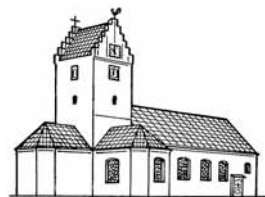
St. GANGOLF, WOLPERTSWENDE