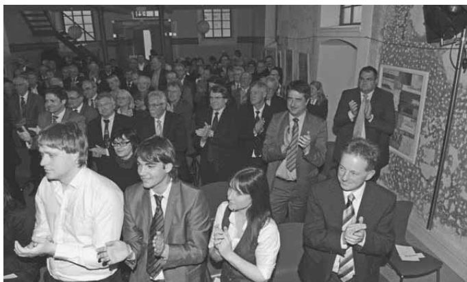
Die Festgäste spendeten dem scheidenden Bürgermeister für seine Arbeit und seine Verdienste um die Gemeinde Wolpertswende langanhaltenden Applaus