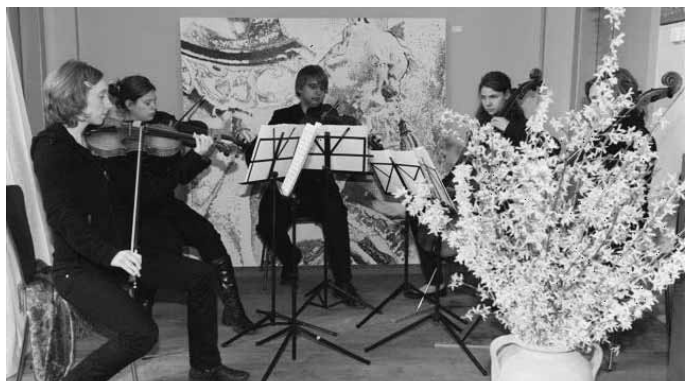
Die Verabschiedungsfeier wurde von einem Streichquintett der Musikschule Ravensburg e.V. musikalisch hervorragend umrahmt