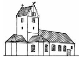
St. GANGOLF, WOLPERTSWENDE