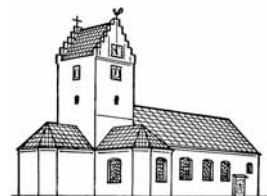
St. GANGOLF, WOLPERTSWENDE