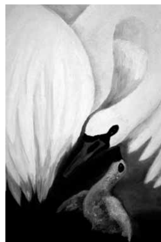
Das hässliche Entlein