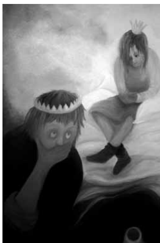
Die Prinzessin auf der Erbse