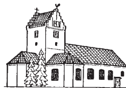
St. GANGOLF, WOLPERTSWENDE