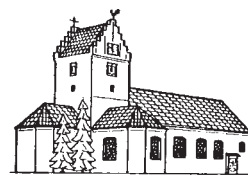
St. GANGOLF, WOLPERTSWENDE