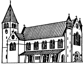
MARIÄ GEBURT, MOCHENWANGEN