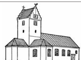
St. GANGOLF, WOLPERTSWENDE