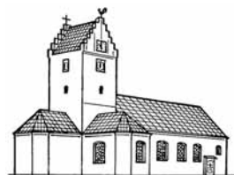
St. GANGOLF, WOLPERTSWENDE