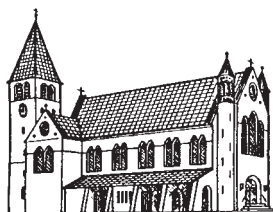
MARIÄ GEBURT, MOCHENWANGEN