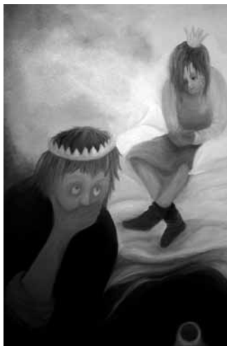
Die Prinzessin auf der Erbse