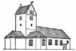
SL. GANGOLF. WOLPERTSWENDE