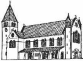
MARIÄ GEBURT. MOCHENWANGEN