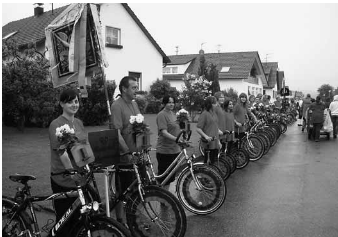
Bei der Aufstellung zur Standwertung