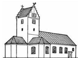
St. GANGOLF, WOLPERTSWENDE