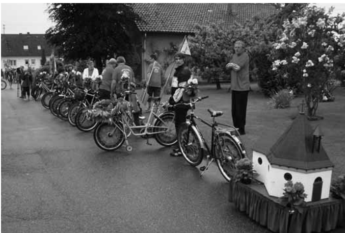
Warten, bis der Umzug beginnt