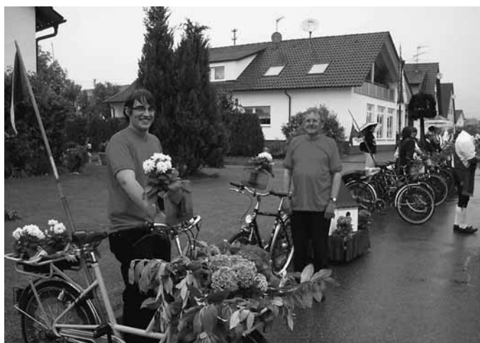
Unsere Gangolfskapelle und das alte Postfahrrad werden immer bewundert.