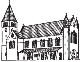
MARIÄ GEBURT, MOCHENWANGEN