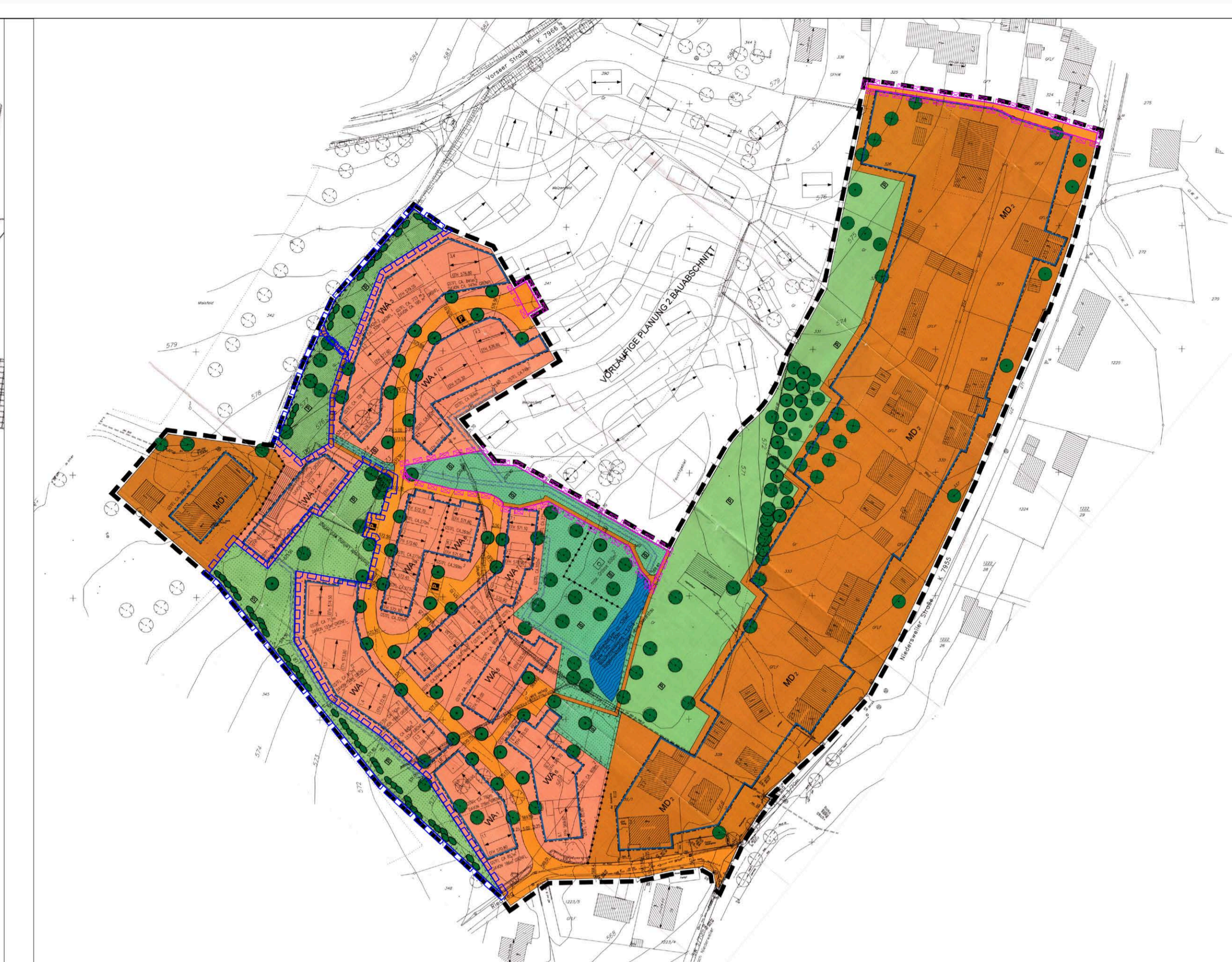
1. Änderung des Bebauungsplanes "Auf der Platte 1. Bauabschnitt" (Fassung vom 23.04.2001, rechtsverbindlich mit Bekanntmachung vom 02.11.2001)